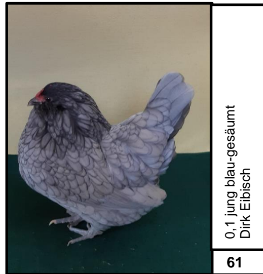
0,1 jung blau-gesäumt Dirk Eibisch