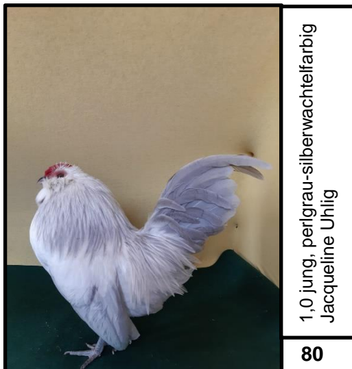
1,0 jung, perlgrau-silberwachteleifarbig Jacqueline Uhlig