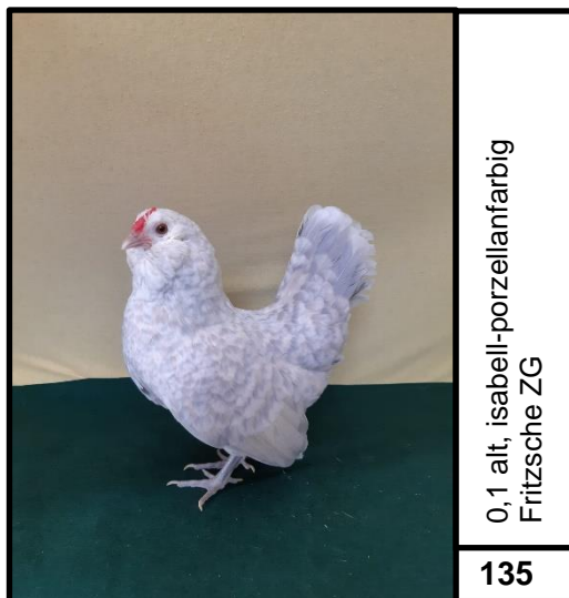
0,1 alt, isabell-porzellanfarbig Fritzsche ZG