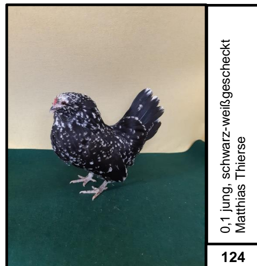
0,1 jung, schwarz-weißgescheckt Matthias Thierse